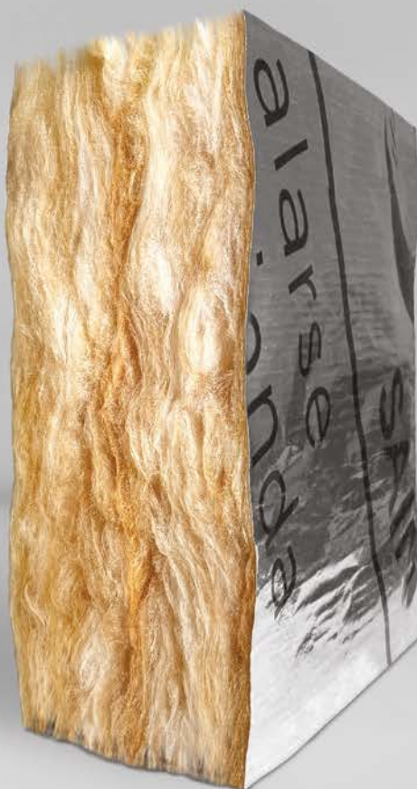
Rolac Plata Muro

Maximiza el rendimiento térmico y acústico de tus fachadas Volcansiding® con ISOVER .